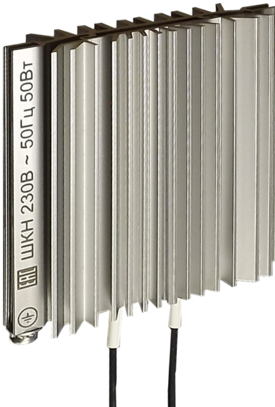
Запатентованный профиль для отвода тепла