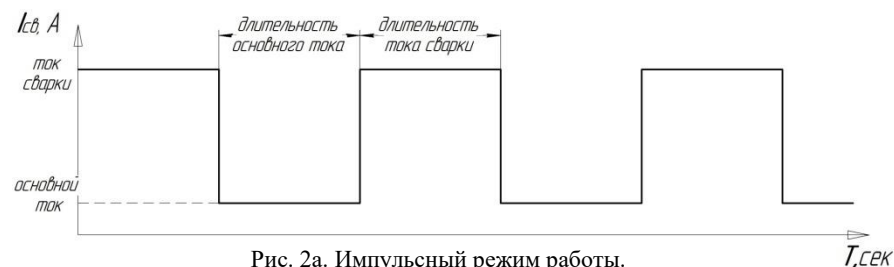
Рис. 2а. Импульсный режим работы.

При завершении сварки после отключения источника сварочной дуги необходимо поддерживать атмосферу защитного газа вокруг сварочной ванны до полной кристаллизации расплавленного металла, чтобы предотвратить его окисление. Данный регулятор устанавливает задержку отключения газового клапана после отключения источника сварочной дуги.