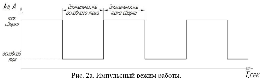
Рис. 2а. Импульсный режим работы.

Данный регулятор используется только при работе в режиме АС (сварка переменным током) и устанавливает соотношение между длительностью тока прямой полярности и длительностью тока обратной полярности (Рис. 2б). Увеличение ширины очистки (длительности обратного тока) ускоряет разрушение поверхностной окисной пленки, что позволяет более уверенно производить сварку алюминия и его сплавов, но при этом возрастает расход вольфрамового электрода. Положение регулятора выбирается сварщиком исходя из практического опыта.