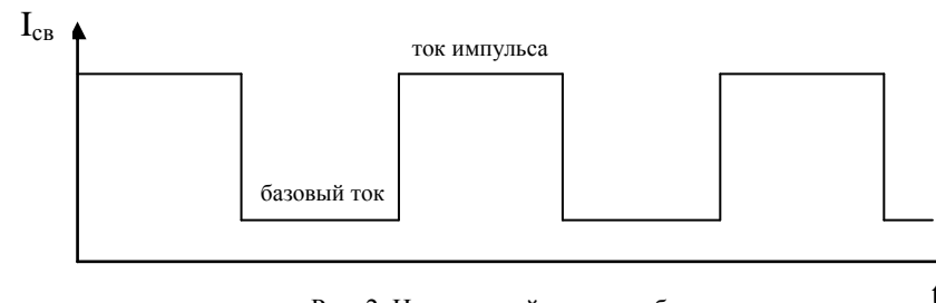
Рис. 2. Импульсный режим работы

При завершении сварочного шва после отключения сварочной дуги возможно образование в конце шва бурта (бугорка). Чтобы этого избежать, при отпускании кнопки горелки сварочный ток в течение времени, заданного данным регулятором, плавно снижается от установленного значения до минимального и затем отключается